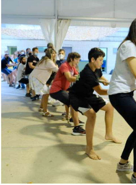
estirada de corda